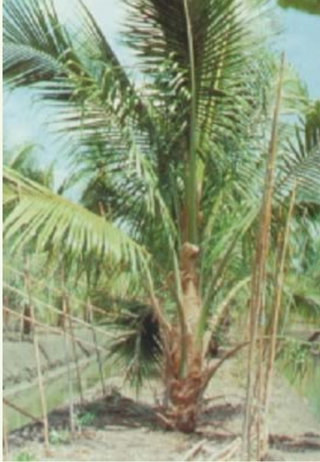
การปลูกแบบสวน