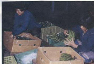
การบรรจุกล้วยลงกล่อง

นอกจากบรรจุภาชนะแล้ว ในบางท้องถิ่นอาจใช้วิธีบรรจุบนกระเบรยยนต์บรรทุก หรือตู้รถไฟแบบห้องเย็น โดยการเรียงหวีกล้วยคว่ำลงซ้อนกันเป็นชั้นๆ