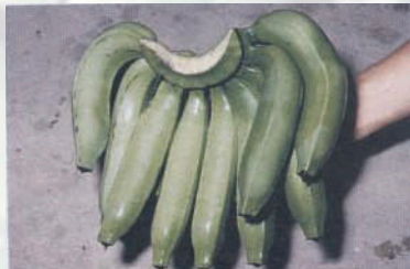
การคัดคุณภาพ

2. การคัดคุณภาพและการคัดขนาด หลังชำแหละกล้วยเป็นหวี ๆ แล้ว ก็อาจจะพบกล้วยบางหวีหรือบางผลมีตำหนิ หรือถูกโรคแมลงทำลาย ก็ให้คัดแยกออก ขณะเดียวกันให้ทำการคัดขนาดหวี และผลกล้วยไปในคราวเดียวกันเลย ตามขนาดเล็ก กลาง ใหญ่