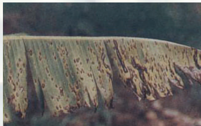
โรคใบจุด

เกิดจากเชื้อหลายชนิด แต่ละชนิดแสดงอาการบนใบแตกต่างกัน ดังนี้ 3.1 ลักษณะอาการเป็นจุดสีน้ำตาลแดงสั้น ๆ ขนานไปกับเส้นใบ บางครั้งกระจายไปทั่วทั้งใบและขยายไปทางกว้าง ทำให้เกิดอาการใบจุดและแผลลามติดต่อกันทำให้เกิดอาการใบไหม้ โดยมากเกิดจากริมใบเข้าไป แผลมีสีน้ำตาลอ่อน ขอบแผลมีสีน้ำตาลเข้ม พบทุกระยะการเจริญเติบโต โดยมากเป็นกับกล้วยน้ำว้า ทำให้จำนวนหวีน้อยลง ขนาดผลเล็กลง