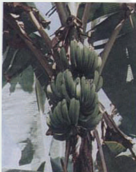
กล้วยหอมเขียว

3. กล้วยหอมเขียว เป็นกล้วยที่มีลักษณะต่างๆ ไปคล้ายกล้วยหอมทองแต่กล้วยหอมเขียวคาบใบชั้นในมีสีแดงสด ปลายผลมน ผลสุกมีสีเหลืองอมเขียว เปลือกหนา เปื่อยที่นิยมของผู้บริโภคในตลาดต่างประเทศ นอกจากนี้กล้วยหอมเขียวยังต้านทานโรคตายพรายได้ดี แต่อ่อนแอต่อโรคใบจุด