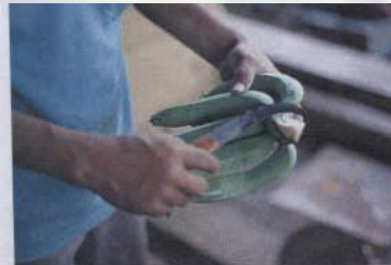
การแต่งหวี

3. บรรจุหีบห่อลงในกล่องหรือเข่งที่บุด้วยกระดาษหนังสือพิมพ์หรือใบตองสดก็ได้ เพื่อป้องกันมิให้กล้วยผิวช้ำหรือดำได้ ขณะบรรจุจะมีการนับจำนวนผลไว้แล้วสำหรับกรณีจำหน่ายแบบนับผล แต่ถ้าจำหน่ายเป็นกิโลกรัม ก็ทำการชั่งน้ำหนัก แล้วเขียนบอกขนาดและน้ำหนักไว้เลยด้วยป้ายกระดาษแข็ง