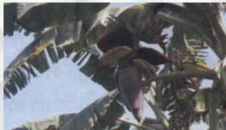
กล้วยออกปลี

เมื่อปลุกกล้วยไปประมาณ 6-8 เดือน กล้วยจะมีลำต้นขนาดใหญ่ พร้อมทั้งจะออกปลี โดยกล้วยจะแตกใบยอดสุดท้าย ซึ่งมีขนาดสั้นและเล็กมาก ชูก้านใบขึ้นชี้ท้องฟ้า ซึ่งเรียกว่า “ใบธง” หลังจากนั้นกล้วยจะแทงปลีกล้วยสีแดงออกให้เห็นชัด และกาบปลีจะบานต่อไปเรื่อยๆ จนกระทั่งผลกล้วยที่อยู่บนหัวเริ่มสั้นและเล็กลง อีกทั้งขนาดแต่ละผลไม่สม่ำเสมอซึ่งเรียกว่า “หวีตีนเต่า” ส่วนหวีที่ถัดจากหวีตีนเต่าลงมาก็จะมีขนาดเล็กมากเท่ากับดอก ในกาบปลีที่กำลังบานอยู่ ถ้าปล่อยให้หัวปลีบานต่อไปเรื่อยๆก็จะเห็นเพียงก้านดอกกล้วยเล็กๆเรียงกัน คล้ายหวีกล้วยขนาดเล็กจิ๋ว การบานของหัวปลีจะทำให้การพัฒนาขนาดของผลกล้วยช้าลง ส่งผลให้ผลกล้วยมีขนาดเล็กไม่โตเท่าที่ควร