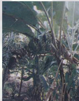
กล้วยเล็บมือนาง

7. กล้วยเล็บมือนาง เป็นกล้วยที่มีลำต้นค่อนข้างเล็กไม่สูงมากนัก ผลมีขนาดเล็ก ปลายผลเรียวแหลม ผลสุกมีสีเหลืองเข้ม เนื้อแน่น รสชาติหอมหวานใช้สำหรับรับประทานสุกหรือทำเป็นกล้วยตาก เป็นพันธุ์ที่ปลูกเป็นการค้าทางภาคใต้ของประเทศไทย จังหวัดที่ปลูกเป็นการค้ามากคือ จังหวัดชุมพร