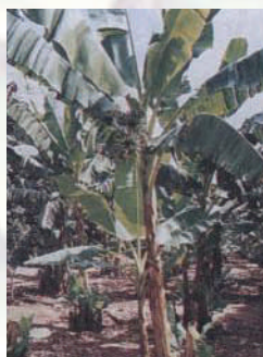
กล้วยไข่

5. กล้วยไข่ เป็นกล้วยที่มีลำต้นสูงบาง สีใบและก้านใบสีเหลืองอ่อนไม่มีนวล คาบใบสีน้ำตาลหรือสีช็อคโกแลต เครือเล็ก ผลมีขนาดเล็กเปลือกบาง เมื่อสุกมีสีเหลืองเข้มเนื้อแน่นรสหวาน เจริญเติบโตได้ดีในที่ร่ม ต้านทานโรคตายพราย แต่อ่อนแอต่อโรคใบจุด