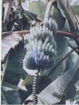
กล้วยหักมุก

6. กล้วยหักมุก เป็นกล้วยที่มีลำต้นขนาดปานกลางลำต้นมีสีเขียวทึบ ผลโตเป็นเหลี่ยมสีเขียวทึบปลายผลเรียว ผลเมื่อสุกมีสีเหลืองนวล เปลือกหนามีรอยแตกหลายงา เนื้อฟูสีเหลืองเข้มเหมาะสำหรับนำมาทำกล้วยปิ้ง กล้วยเชื่อม