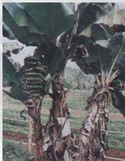
กล้วยหอมค่อม

4. กล้วยหอมค่อม เป็นกล้วยหอมอีกชนิดหนึ่งลำต้นเดี่ยวหรือแกระ ผลมีลักษณะคล้ายกล้วยหอมเขียว เนื้อรสชาติดี จึงมีชื่อว่ากล้วยหอมเขียวเดี่ยวอีกด้วย