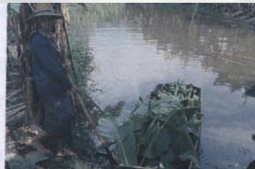
บรรจุทุกกล้วยลงเรือ