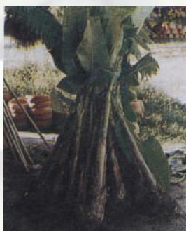
หน่อลัวยไข่

เตรียมอุปกรณ์ชุดได้แก่เสียมหรือชะแลงหน้ากว้างที่คมสำหรับขุดตัดแยกหน่อจากต้นแม่และขณะเดียวกันก็สามารถใช้จัดหน่อที่ตัดแยกจากต้นแม่แล้วนำหน่อมาตัดรากออกด้วยมีดได้ แล้วกลบดินไว้ตามเดิม