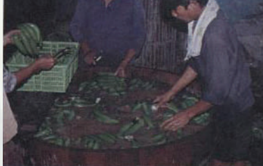
ชำแหละและทำความสะอาดด้วยน้ำยา

1. ทำการชำแหละหวีกล้วยเป็นหวี ๆ แล้วบรรจุหีบห่อส่งตลาดปลายทางเพื่อนำไปบ่มขายในตลาดผู้บริโภคต่อไป ช่วงขณะชำแหละหวีกล้วยต้องระวังน้ำยางกล้วยจะเป็นผลกล้วยซึ่งจะดูไม่สวยงามอาจชำแหละลงในน้ำแล้วล้างให้แห้งหรือเป่าด้วยพัดลม