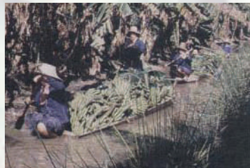
การลำเลียงผลผลิต

ในการส่งกล้วยไปจำหน่ายในตลาดปลายทางที่ค่อนข้างไกล หรือตลาดต่างประเทศที่ต้องการกล้วยดิบ ในกล้วยหอมทองมักมีปัญหาเพราะสุกง่าย แม้ไม่ต้องบ่ม การทำให้กล้วยสุกช้าโดยใช้อุณหภูมิต่ำในการขนส่ง ก็จะช่วยชะลอการสุกได้ระยะหนึ่ง ทั้งนี้รวมถึงการใช้สารละลายโปแตสเซียมเปอร์มันเจนต (ด่างทับทิม) ใส่ลงไปในกลุ่มก็สามารถชะลอการสุกได้อีกวิธีหนึ่งด้วย